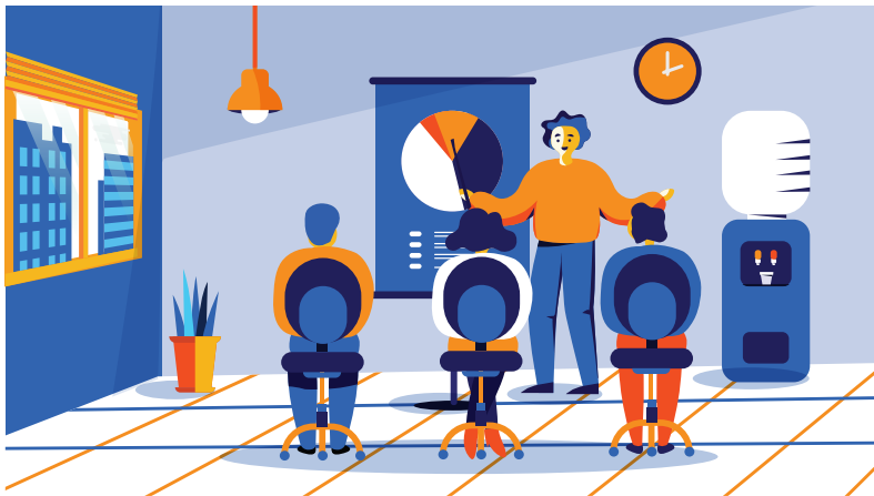
打造企业文化 ZL1 助你大展宏图