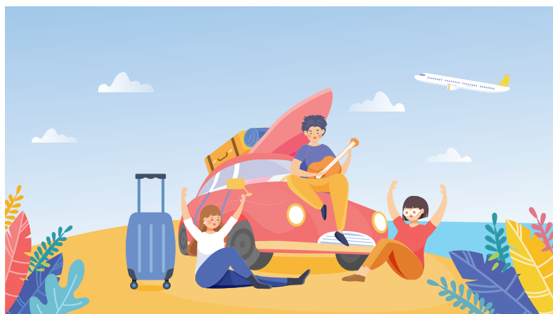
自在生活 ZL1 助你怡然自得