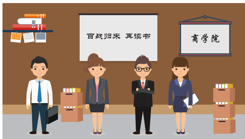
勇做弄潮儿 ZL1 助你一臂之力